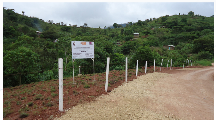
(Foto Sitio Clausurado, cabecera municipal municipio de Sitalá, 2012).

Una vez que ya se haya desarrollado la infraestructura para mejorar el manejo de los residuos sólidos urbanos será necesario mitigar los efectos que el anterior sitio de disposición final puede causar o evitar que se convierta en un pasivo ambiental. Es por ello que a la par se deben elaborar estudios, proyecto ejecutivo e informe preventivo de impacto ambiental para la clausura definitiva de este sitio.