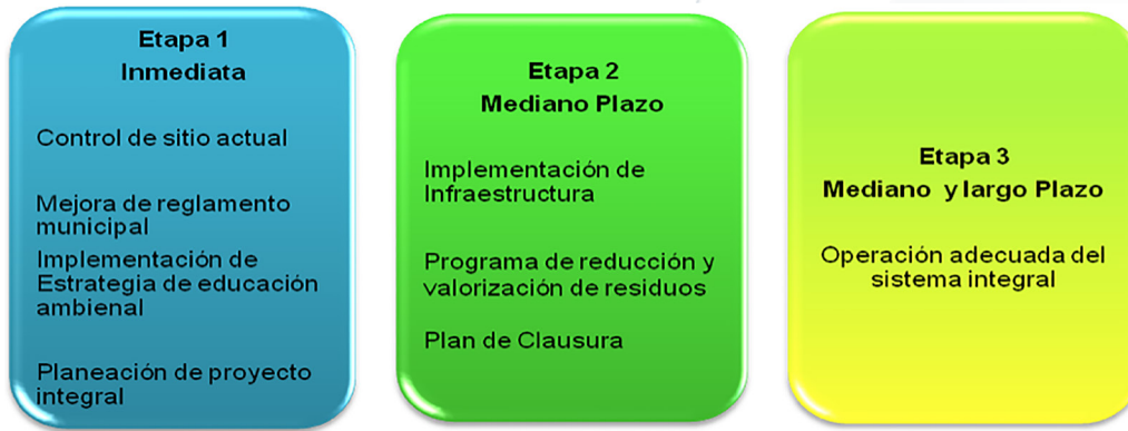
Figura 1 Ruta Crítica para regularizar el manejo de los RSU y RME