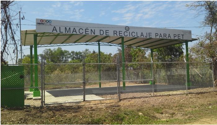
(Foto Área de reciclado en el ejido Benito Juárez, municipio de la Concordia. 2014).

otro aspecto a considerar en esta estrategia debe ser la inclusión, considerar a quienes hoy en día se dedican a la recuperación de materiales de manera informal, establecerá un éxito en la estrategia, ya que ellos están en contacto directo con la población, fortalecer la cadena de valor para ir creando una cultura ambiental y que en cada hogar se separen los residuos para facilitar su recuperación.