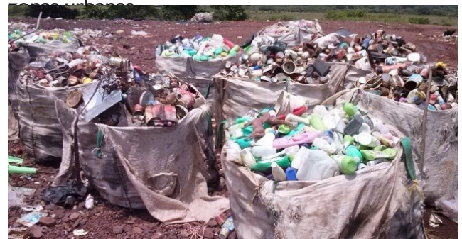
Foto: Recuperación de PET Municipio la Concordia. 2016

En México la recuperación de subproductos se hace generalmente durante la recolección, separando el material reutilizable como cartón, vidrio, fierro, papel, trapo, o bien directamente en rellenos sanitarios, mediante un proceso de separación de residuos, destinando un área fuera de la celda de disposición final para la realización de dicha separación. Esta actividad puede hacerse formal desde una banda de separación a cargo del municipio o una empresa particular, también de manera informal a través de recicladores locales a menor escala, esta última es muy común en las